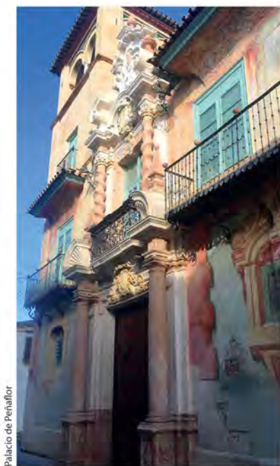
Palacio de Peñaflor