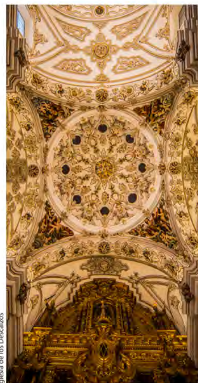
Iglesia de los Descalzos