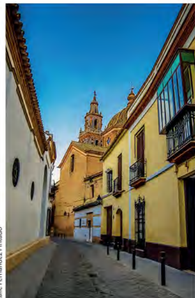
Calle Fernández Pinedo

Todo el siglo XVIII, considerado "el siglo de oro ecijano", Écija vive un esplendor de