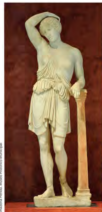
Amazona Herida, Museo Histórico Municipal

Iglesia y torre barroca del siglo XVIII. Destaca una interesante colección arqueológica en el claustro, con piezas de diferentes épocas y