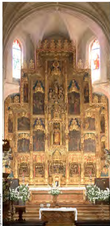
Iglesia de Santiago